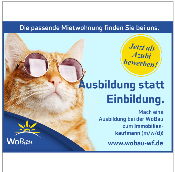
- Mach eine Ausbildung!