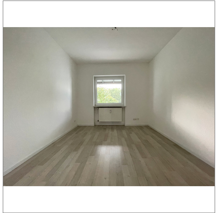
- Kinderzimmer 2