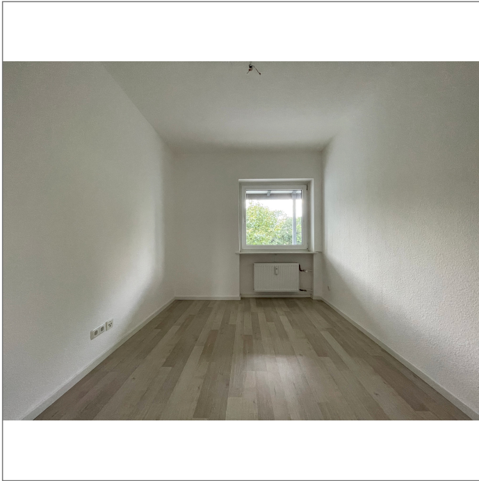
- Kinderzimmer 1