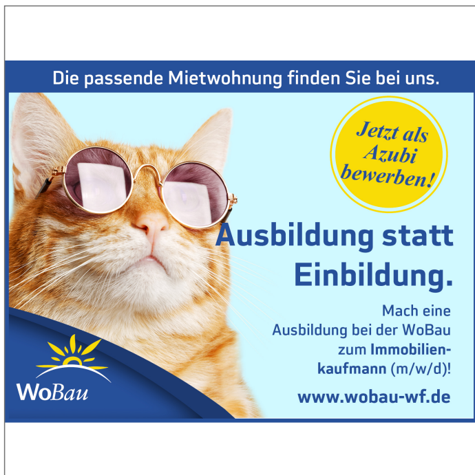
- Mach eine Ausbildung!